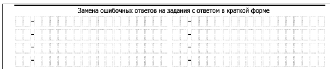
Рис. 3. Область замены ошибочных ответов на задания с кратким ответом

В случае, если КИМ не предусматривает записи ответа на бланке №1, поле для записи ответа будет заполнено символами «XXX»