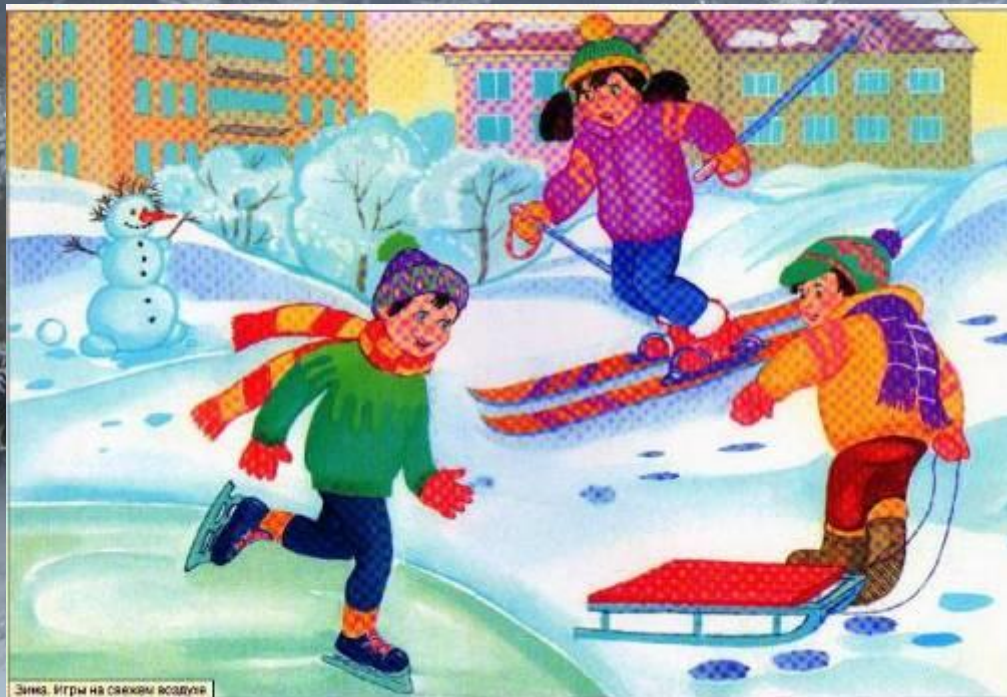
Зима. Игры на свежем воздухе